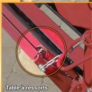
Table à ressorts