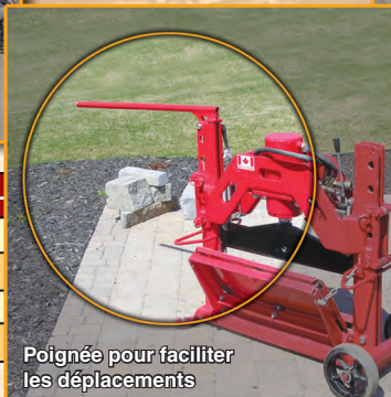
Poignée pour faciliter les déplacements